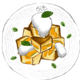
パンプキンチーズケーキ