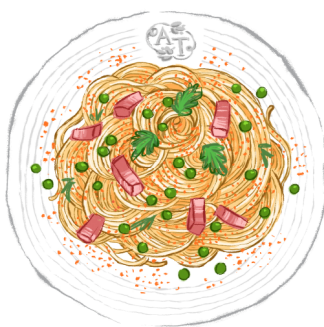
とびっこのあっさりカルボナーラ