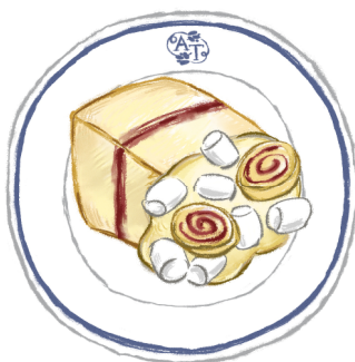
チーズカスタードケーキ