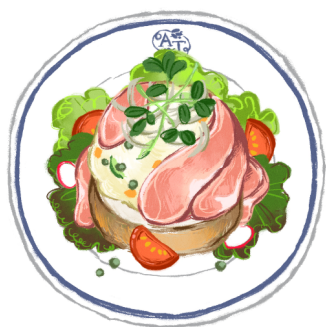
プロシュートマフィン

ポットにたっぷりのおいしい紅茶をまんなか、幸せがひろがるスイーツや、個性的なサンドイッチやパスタなど、見た目のかわいさだけではなく、確かなおいしさを提供すること、そして何より、おいしい紅茶と一緒に食べていただくことを大切に作られています。日常のなかで、午後のお茶の時間を愉しむという、心地よい刺激を感じてほしい。Afternoon Tea TEAROOM 誕生以来、変わることはない想いが込められています。