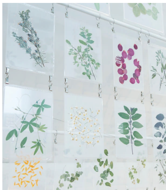
店頭 ディスプレイイメージ