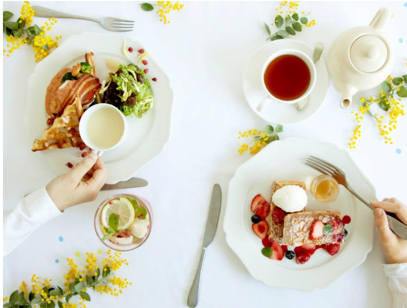
『Spring BRUNCH & TEA』イメージ