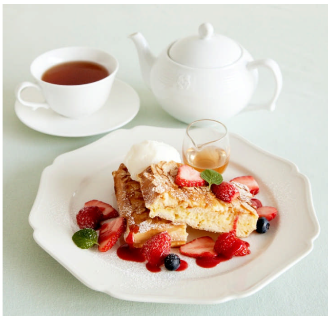
スイーツ（甘系）／苺のブリュレワッフル

この春、ほんのり甘いワッフルをベースに、セイボリー※（塩系）とスイーツ（甘系）2種類の味わいが楽しめるブランチメニューを発売します。ボリューム満点の食事として愉しみたい方には「エッグベネディクトワッフル」がおすすめです。アボカドとチーズをのせて焼き上げたワッフルに、エビ、ビスクソース、ポーチドエッグを添え、世界中でブームの“エッグベネディクト”をアフタヌーンティー流にアレンジしました。