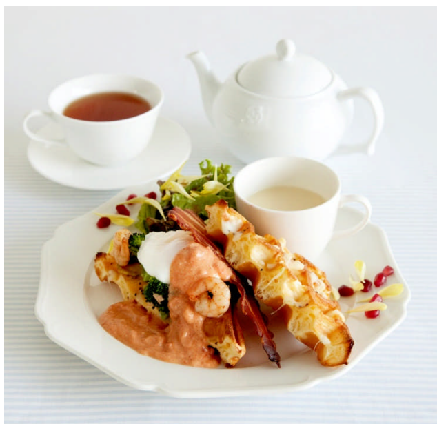
セイボリー（塩系）／エッグベネディクトワッフル

株式会社サザビーリーグ（本社：東京都渋谷区千駄ヶ谷／代表取締役社長 森 正督）が運営するアフタヌーンティー・ティールームは、『Spring BRUNCH & TEA』をテーマに、セイボリースタイルの「エッグベネディクトワッフル」とスイーツスタイルの「苺のブリュレワッフル」2種を、3月31日（木）から全国の店舗で発売します。また、関東エリアの限定4店舗では、「Have a Herbal Harvest」とコラボレーションしたハーブティーを発売するほか、テイクアウトコーナーを“飾れるハーブティー”で彩ります。