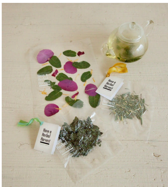
限定発売「ハーブティー3種」