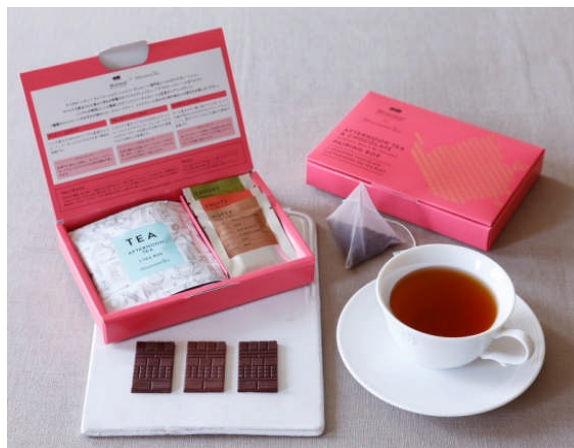
ペアリングボックス