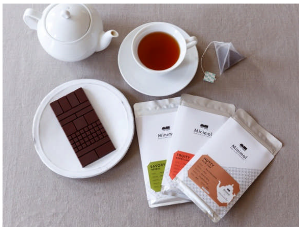
ビントウバーチョコレート 3 種