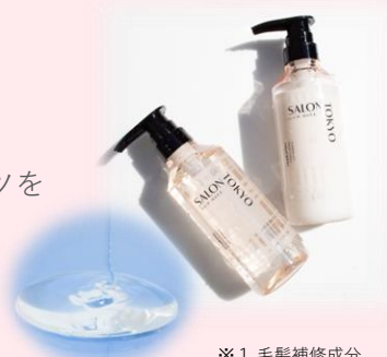
※1 毛髪補修成分 ※2 保湿成分

まるで都会の中のアオアシスにいるかの様な安らぐ香り。草原を感じるヴァーベナとシトラスに、フレッシュフルーツを加え、心安らぐ爽やかな香りに仕上げました。