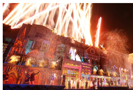
※画像は昨年の様子です。

『天使のくれた奇跡Ⅱ ～The Song of an Angel～』は、コーポレート・マーケティング・パートナー企業の株式会社エディオンが協賛します。