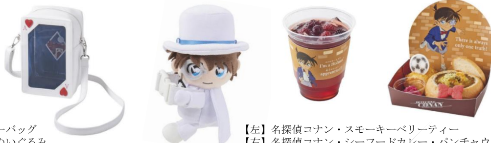
【左】ショルダーバッグ 【右】だきつきぬいぐるみ

2024年4月12日(金)に公開される劇場版最新作「名探偵コナン 100万ドルの みちしるべ 五稜星」と連動した『名探偵コナン・ワールド』からは、作品に登場する人物やアイテムを身近に感じ、 作品の世界に入り込めるフードとグッズが登場 します。「江戸川コナン」の必需品であるサッカーボールや蝶ネクタイ変声機が散りばめられたプレートや、コナンらしさを感じられるドリンクをお楽しみいただけます。さらに、「怪盗キッド」のトランプをモチーフとした「ショルダーバッグ」や、カバンなどに取り付けて楽しめる「だきつきぬいぐるみ」など一緒にパークを楽しめるパークだけの「名探偵コナン」グッズが新登場します。