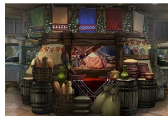
レストラン店舗内観イメージ