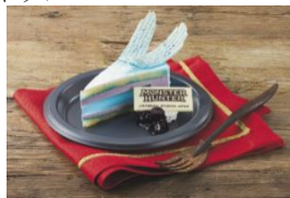
イヴェルカーナの極寒ケーキ ～ブルーベリー～

※1: 商品の販売場所や販売開始日など詳しくは公式 WEB サイトをご確認ください。 メニューのデザイン、販売開始日などは予告なく変更する場合があります。