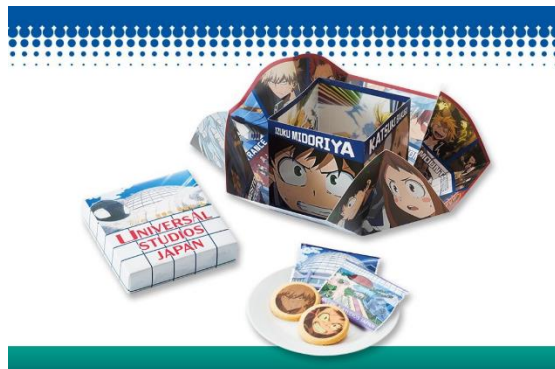
プリントクッキー