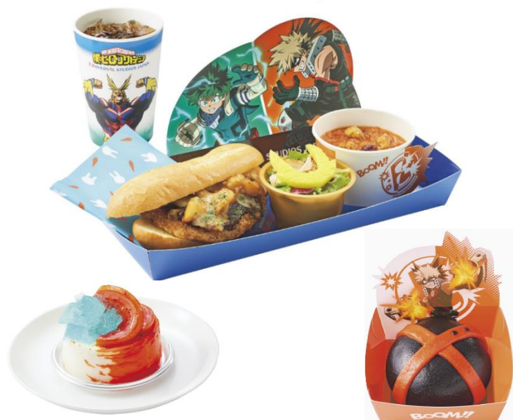
【上】オールマイト特製！カツサンドセット 【左】轟の“半冷半燃” フロマーージュブラン オレンジ&スパイス ＜提供場所＞ピバリーヒルズ・ブランジュリー 【右】爆豪の“爆破” 麻婆肉まん ＜提供場所＞シネマ 4-D ストア前フードカート

緑谷出久（デク）と爆豪勝己の好物をオールマイトが大胆にアレンジした特製メニューや、轟焦凍の“個性”『半冷半燃』をムースで表現したデザート、辛いものが好きな爆豪の麻婆風味のあんがギッシリ入った食べ歩きフードなど、ファンの熱い期待に応える“超リアル”なオリジナルフードが登場します。また、デク、爆豪、麗日お茶子、轟のヒーローコスチュームをイメージした「カチューシャ」や、作中にも登場する訓練施設「USJ（ウソの災害や事故ルーム）」をモチーフとした「プリントクッキー」など、“個性”を活かしたファン必見のラインナップをお楽しみいただけます。