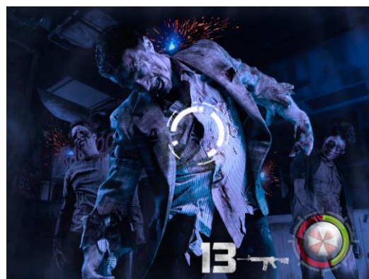
↑「プロジェクション・ゴーグル」の映像イメージ

ラクーンシティでの戦いに巻き込まれたゲストは、ユニバーサル・スタジオ・ジャパンがこのアトラクションのために独自開発した、新登場の「プロジェクション・ゴーグル」を装着し、日常ではありえない、究極の戦闘に挑みます。世界最新鋭の技術によって実現した、目の前を乱れ飛ぶ無数の弾丸や耳元で鳴り響く銃声や、引き金を引いた瞬間の銃撃感覚で、ゲストの興奮は極限まで高まります。さらに、ゾンビやクリーチャーの襲撃により減少するライフゲージやみるみる少なくなる残弾数が、究極の緊張感をもたらします。