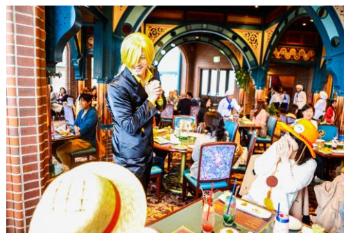
※写真は過去開催時のものです

※『サンジの海賊レストラン』は事前の座席予約が必要なテーマレストランです。一部当日券もご用意しております。