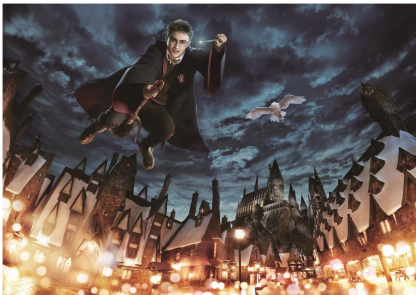
HARRY POTTER, characters, names and related indicia are trademarks of and © Warner Bros. Entertainment Inc. Harry Potter Publishing Rights © JKR.(s15)

世界最高アトラクションが早くも進化！世界初3D化で、かつてない臨場感へ 『ハリー・ポッター・アンド・ザ・フォービドゥン・ジャーニー』