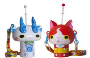
<写真左>ヨキシマムゴッド・ゼリー <写真右>