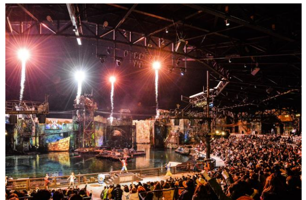
※写真は過去開催時のものです

さらに昨年は、その卓越したスケールとクオリティが認められ、世界のテーマパークやアミューズメント業界で世界的権威を誇る「 ブラス・リング・アワード ライブ・エンターテインメント・エクセレンス部門 最優秀総合プロダクション賞 」を受賞。「世界最高」ライブ・ショーとしての地位を確立しました。