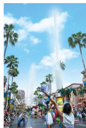
※写真は過去開催時のものです