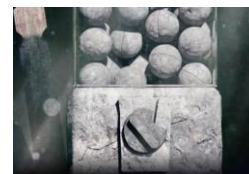
←ラリーで体験できる「妖怪ガシャ」もリアルに再現(画像はイメージ)

同時開催となる「妖怪ウォッチ・ザ・ラリー ～妖怪不祥事案件を探せ!!～」(有料)では、パーク中のいたるところに残された痕跡を頼りに、隠れた妖怪を探し出すアドベンチャー・ラリーをお楽しみいただけます。全ての妖怪を発見すると、ゴールでリアル「妖怪ガシャ」体験にチャレンジ。ステキなアイテムが入手できるかも!他にも「妖怪ウォッチ」でお馴染みのお店やメニューも登場し、飲食体験においてもゲームやアニメの世界観を味わうことができます。また、ジバニャンを模ったドリンクボトルなど、お子様が喜ぶアイテムも続々登場。妖怪ウォッチの世界を満喫いただけます。