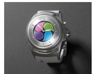
↑リアルに再現した妖怪ウォッチ