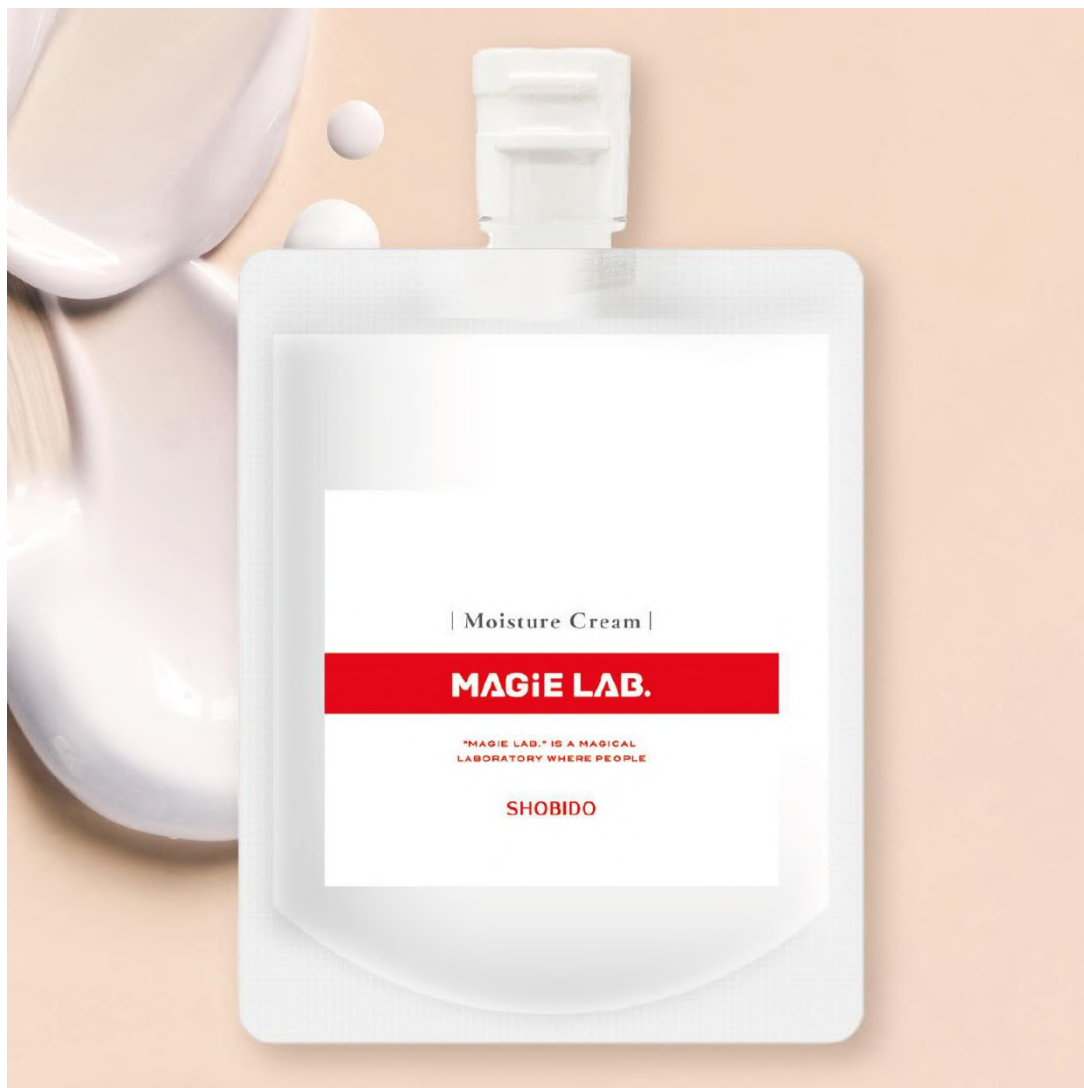
マジラボ フェイスクリーム (しわ伸ばしテープ専用クリーム) 120g 2,860 円(税込)