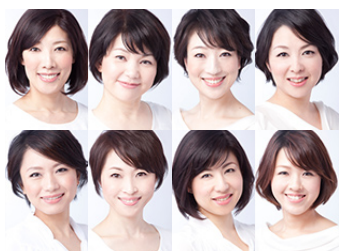
資生堂ビューティースペシャリスト

女性の美しくなりたい願いと肌をサポートするブランド公式コミュニティ「エリク・スクール」スタート