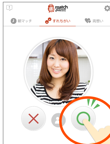
②プロフィールの確認と好意の送信