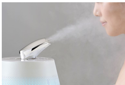
ビューティアタッチメント装着時