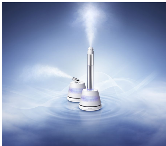
写真1 Youragi 潤水 プレミエール