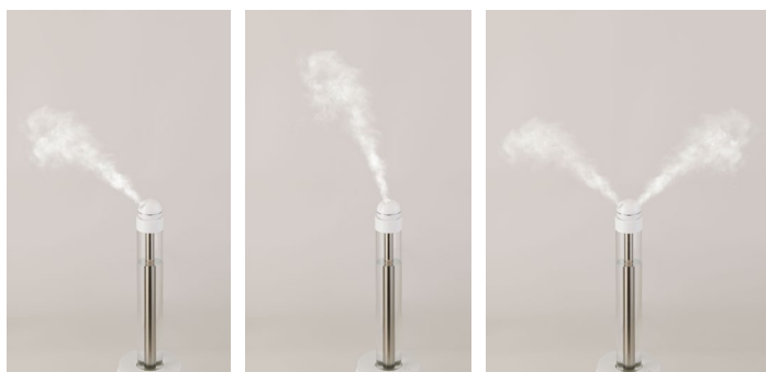
スマートヘッド装着時