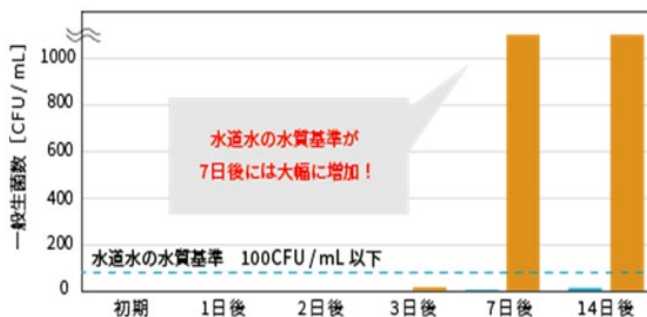
グラフ1 一般生菌数の変化