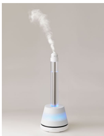
写真2 (左：加湿モード、右：美容モード)