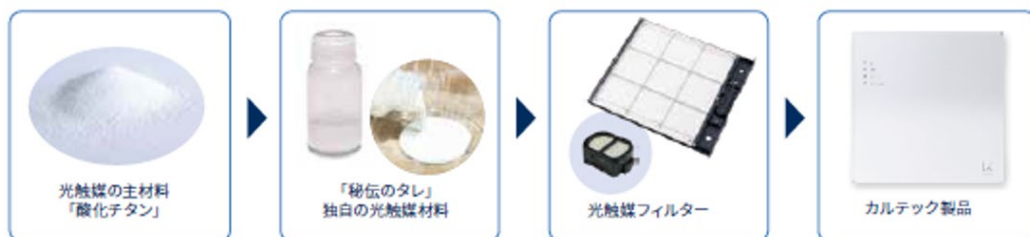
図2 材料から製品まで一気通貫で開発

カルテックの光触媒は業界最高水準の性能を実現しています。なかでも光触媒材料は唯一無二の「秘伝のタレ」。この光触媒材料に独自の工夫を施すことで高性能でかつ耐久性に優れた光触媒を実現し、世の中になかった製品を数多く創出しています。