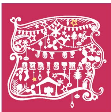
JOY OF CHRISTMAS テーマロゴ