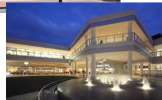
たまプラーザ テラス