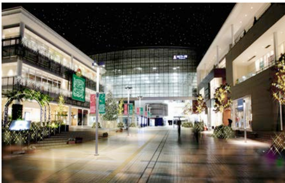
左上：ステーションコート 【初】壁面照明を施す