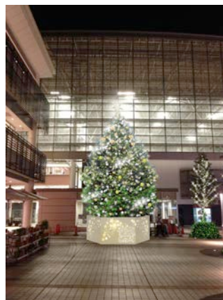
ステーションコート ビッグツリー