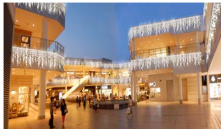
右下：アウトモール【初】空中照明・植栽照明を実施