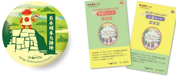
記念缶バッジ（左・デザインはイメージ）とコース達成認定証（右）