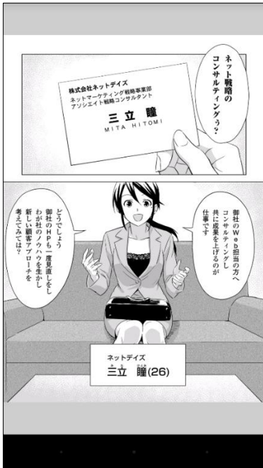
Android スマートフォンで縦画面表示の図

Web ブラウザーなどでの閲覧とは違い、電子書籍閲覧アプリで、書籍として楽しむことができます。