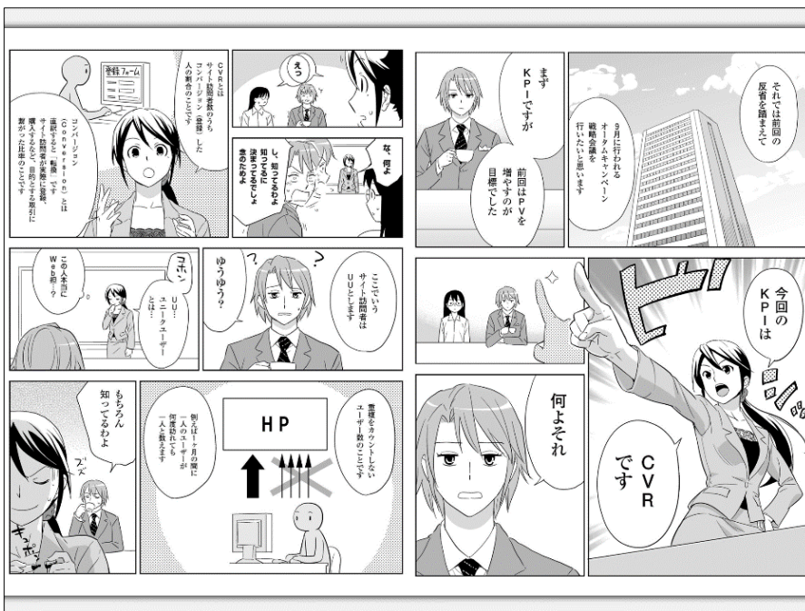
iPad で横画面表示した図