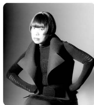
ファッションデザイナー コシノジュンコ

一度は廃れた五所川原の祭り「立佞武多」。巨大な山車とその祭りを復興させた東北地方の人々の想いが2015年2月13日、18000km離れた地球の裏側・ブラジル・サンパウロのサンバカーニバル名門チームのステージに届けられようとしています。日本とブラジル、気候や風土はもとより、伝統や風習文化の違う両国の祭り。人間が生きていく上で活力となる「祭り」のエネルギーが、国境や人種を超えて結びつきます。