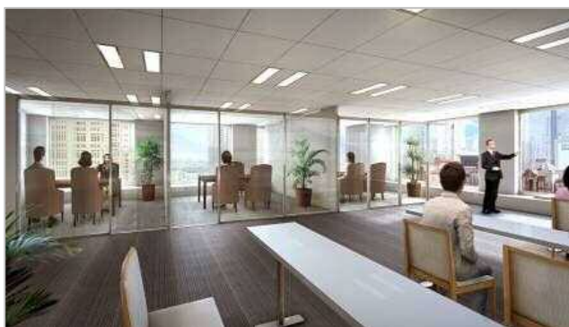
『丸の内相続プラザ』の内観イメージ（東京・丸の内）

また、オープンスペースでは、一般の方々向けの相続セミナーや、税理士や弁護士などの「士業」および金融機関や不動産会社、生命保険会社など、相続に関連する業界に勤める方々を対象とした勉強会などを毎月定期的に開催していきます。（※直近のセミナー情報につきましては次頁をご参照ください）