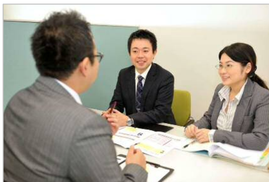
個室型ブースで経験豊富なスタッフが相続の相談に応じる（完全予約制）