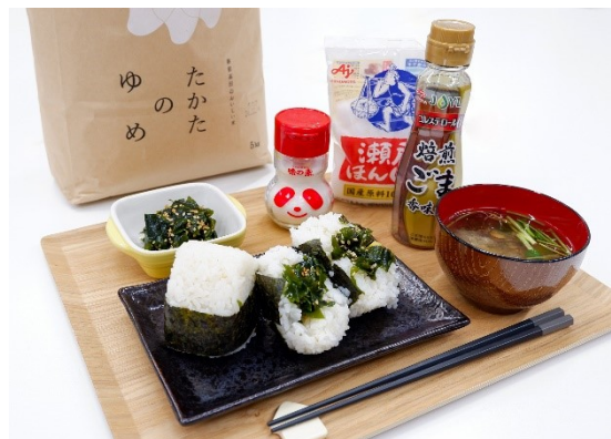
陸前高田市のわかめと同市のブランド米「たかたのゆめ」、当社グループの調味料を使った「わかめナムルおにぎり」