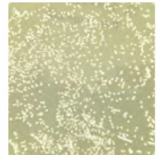
ローズマリーエキスpri無し (白い点々がアクネ菌の集まり) <自社比較>