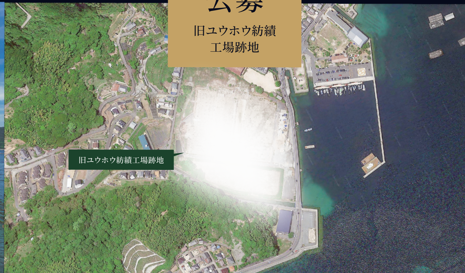
旧ユウホウ紡績工場跡地