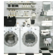
| 当日使用した「THE LAUNDRESS」おすすめア イテムを含む豪華セット