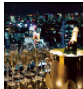
| スパークリングワインと ローストビーフで楽しむ 贅沢なレッスン