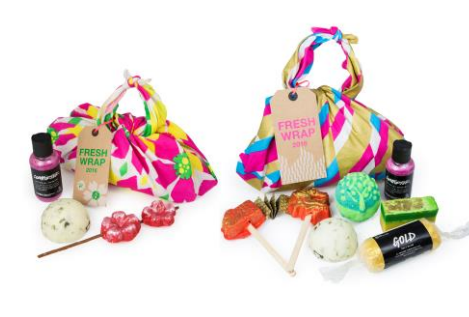
『フレッシュラップ』