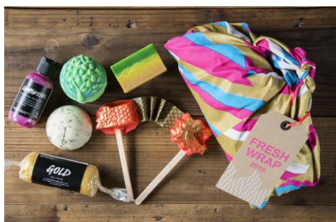
『フレッシュラップ 5000』

フレッシュハンドメイドコスメ LUSH(ラッシュ)は、2016年1月1日(金)より、『フレッシュラップ』をラッシュ全店及びラッシュ通信販売にて数量限定で発売いたします。また、本発売に先がけ、2015年12月1日(火)より、先行予約の受付を開始いたします。福袋の話題でにぎわう新年、ラッシュの『フレッシュラップ』は、限定デザインのオーガニックコットンでできた風呂敷『KnotWrap(ノットラップ)』の中に、店舗では春まで入手できない、一足早く春を感じる限定商品の数々がセットされています。また、『フレッシュラップ』を事前予約してご購入された方の中から限定で、様々な体験を通じてラッシュブランドを垣間見ることができる、ラッシュキッチンツアーの参加や、ラッシュスパ体験など、さらなる特典が当たるチャンスもあります。