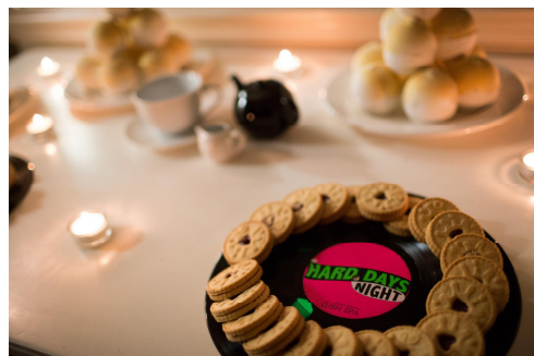
トリートメント後にはジャム入りクッキーと紅茶でリラックス