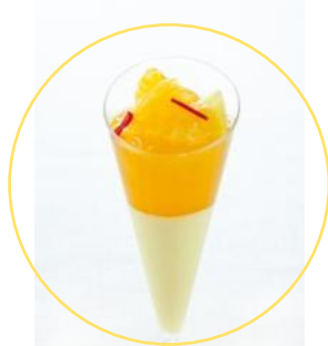
トロピカルカクテル