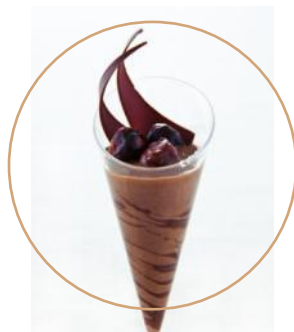
ショコラノワール