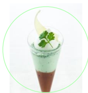
爽やかチョコミント