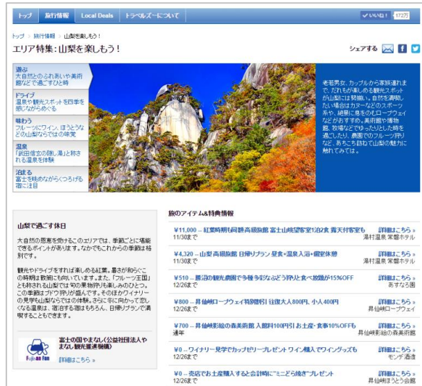
山梨県甲府・勝沼エリア特集ウェブサイト