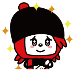
マクロミルモニタサイトの マスコットキャラクター キク美