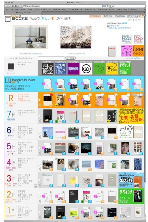
↑ BCCKS HOME (トップページ)

関連サイト： http://becks.jp/ http://davinci.becks.jp/ http://jugumi.becks.jp/ http://becks.jp/center/shikisoku http://becks.jp/center/eatrip http://littlemore.becks.jp