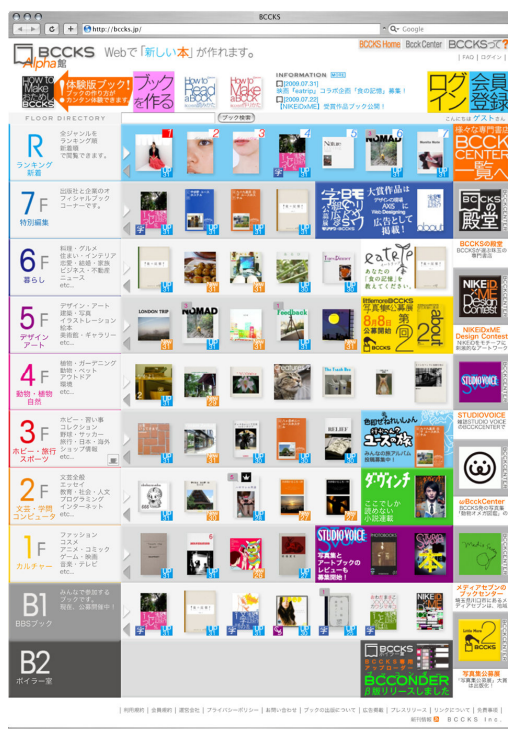
↑ BCCKS HOME (トップページ)

関連サイト： http://bccks.jp/ http://davinci.bccks.jp/ http://jugumi.bccks.jp/ http://bccks.jp/center/shikisoku http://bccks.jp/center/eatrip