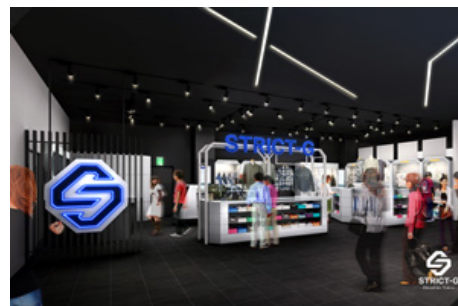
『ガンダムフロント東京イメージ』

住所: 〒421-1224 静岡県静岡市葵区飯間1258 電話: 054-295-9121 営業時間: 8:00~21:00