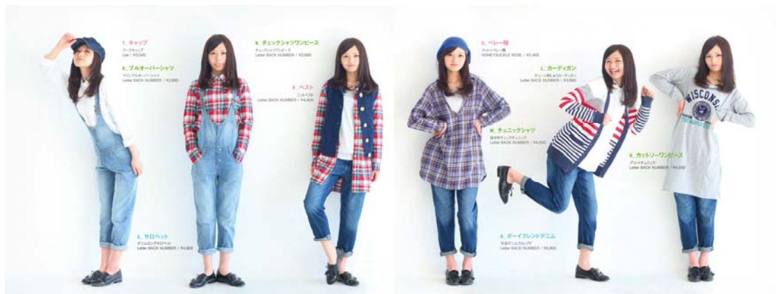
#1 SALOPETTE PANTS サロペット