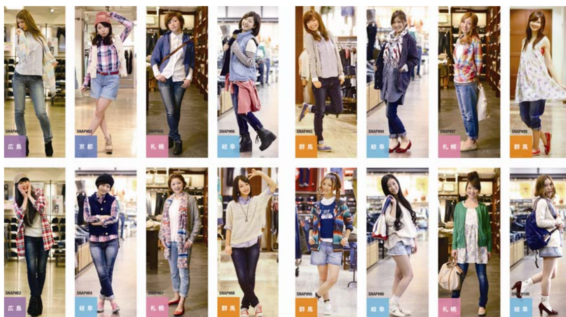
#2 BOYFRIEND DENIM ボーフレンドデニム

全国7地方都市(北海道、新潟県、群馬県、岐阜県、京都府、広島県、佐賀県)100人のデニムスタイルスナップを掲載します。また、「デニムに絶対必要な20アイテム」と題し、使いやすいベーシックなアイテムを紹介するページや、デニムの着回しページ、デニムのカテゴリーに分けたスナップ特集など見応えのある全48ページです。