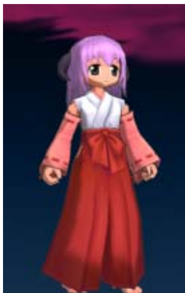
羽入セット (羽入の巫女服、羽入の角)