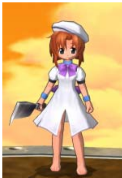
竜宮レナセット (帽子、ワンピース、鉈)