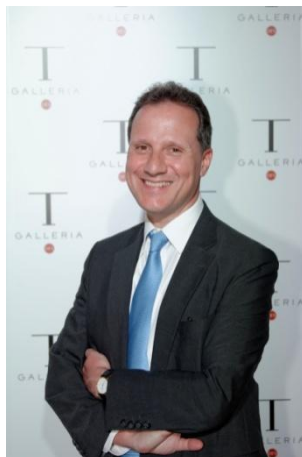
<デイヴィッド・エイトケン>