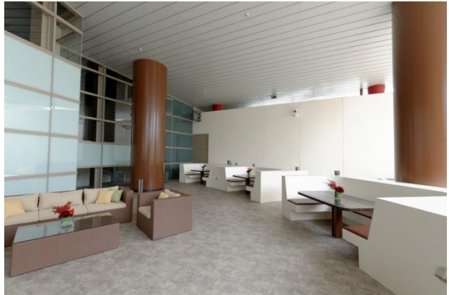
<プレステージ・ラウンジ>