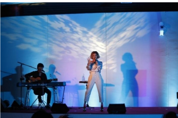
<BENI さんのライブ・パフォーマンス>