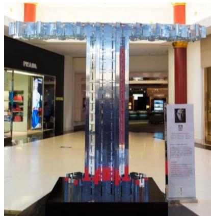
<リバースプロジェクト制作「T in Art」>

その後に開催されたカクテル・パーティでは、沖縄らしく泡盛での鏡割りを行い、その泡盛は会場に集まったお客様へ振る舞われました。そして本パーティのハイライトは同じくデビュー10周年を迎えた BENI さんのライブ・パフォーマンスでした。BENI さんは沖縄出身の歌手でもあることから、沖縄の曲を含め全3曲披露していただき、会場は大いに盛り上がりを見せました。