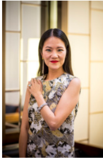
中国在住 編集者兼スタイリスト