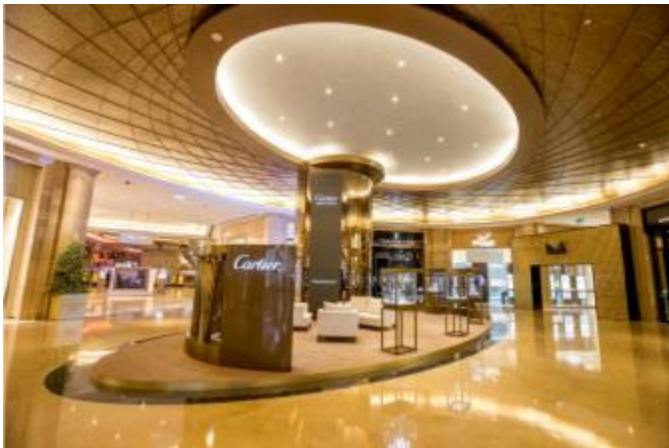
カルティエ 高級時計&ジュエリー展