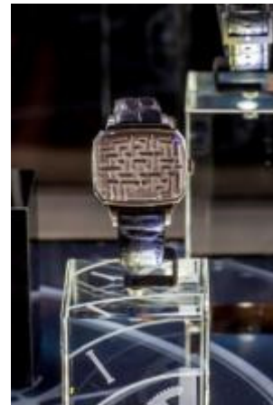
オートランス ラビリンス

世界をリードするラグジュアリー トラベル リテーラーであるDFSグループは、12月3日（土）、マカオにて、今年で8年目となるDFS マスタース オブ タイム エキシビションを開始しました。ラグジュアリータイムピースの世界最大のエキシビションとして、25もの世界一流ブランドの400を超える高級時計とジュエリーから成る比類なきコレクションと、これらの逸品を創り上げたマスターが集まるDFS マスタース オブ タイム。本イベントのパートナーでもあるショッप्ス アット フォーシーズンズに位置するT ギャラリー マカオ by DFSにおいて、華やかなガライベントを行い、選りすぐりのコレクションを発表。2017年2月28日（火）まで引き続き店舗で展示され、前例のない規模で集められた高級時計とジュエリーをお楽しみいただけます。