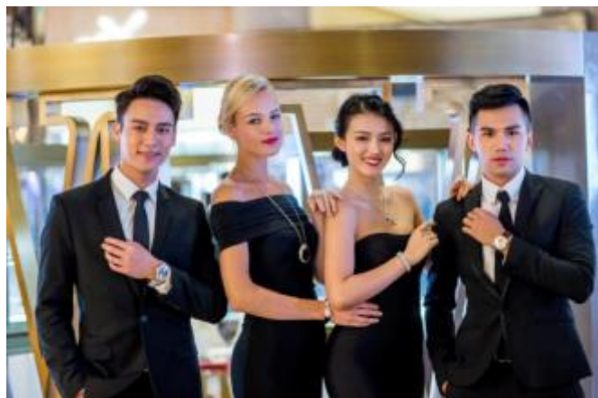
カルティエでは2016年国際高級時計サロンの11点の新商品を展示