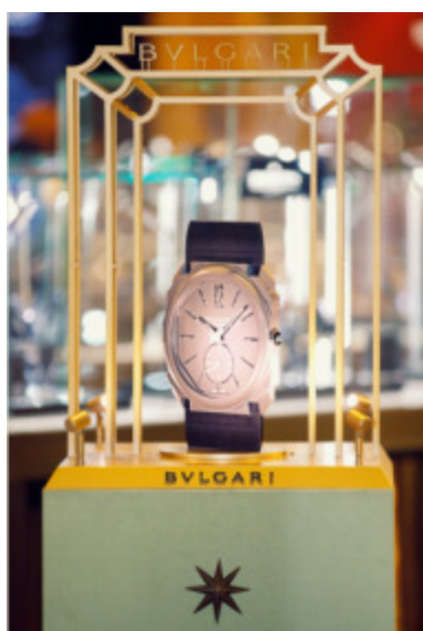
ブルガリ オクト フィニッシモ ミニッツリピーター