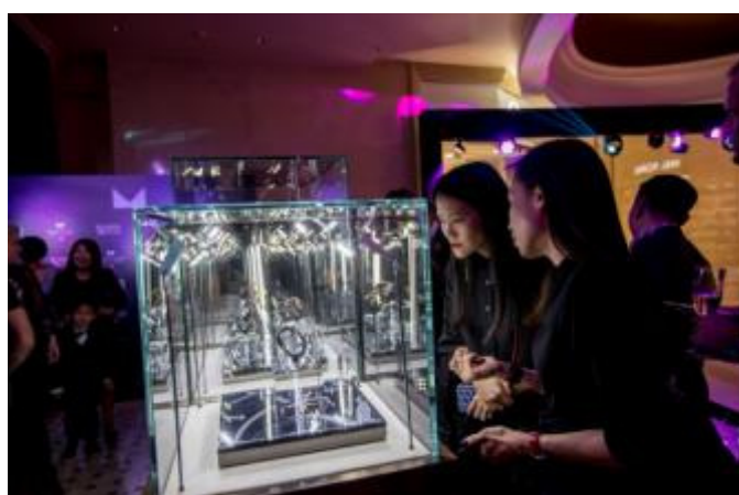
400を超える超一流タイムピースを展示