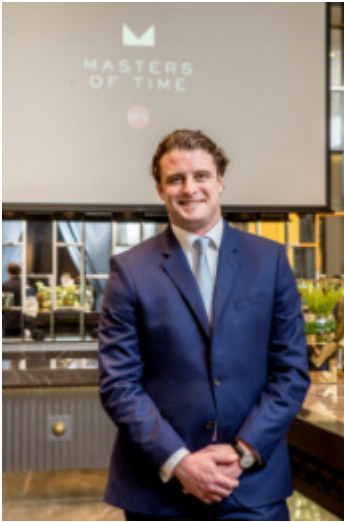
ホワイト&マックイ