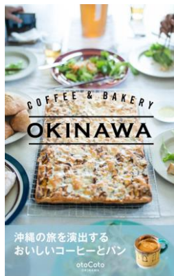
otoCoto OKINAWA シリーズ紙書籍