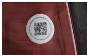
上着内側の QRコード画像

◆お役立ち情報満載の「PERSON'S CLUB」 「PERSON'S CLUB」の主なコンテンツは、「PERSON'S FOR MEN」のブランドコンセプトと物作りのこだわりの他、スーツの知識を基礎から学べるビジネスコミックや、ビジネスウーマンが語る“出来る男”の着こなし術、「PERSON'S CLUB」限定の割引クーポンなど、ビジネスマンを応援する情報を満載しています。また、コンテンツの内容は月2回更新されるため、飽きることなく随時新しい情報を入手することができます。