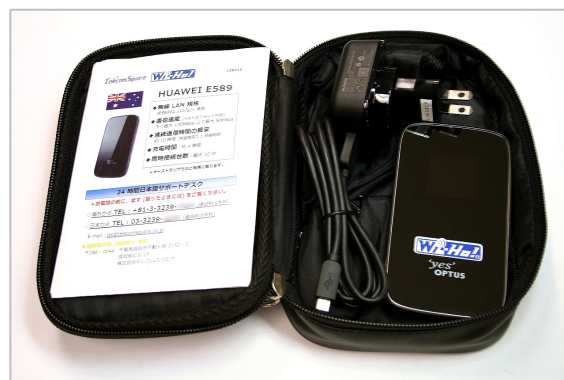
「Wi-Ho!」オーストラリア専用

※1 理論値のため実測値とは異なります。ネットワークの通信速度は、理論値で下り最大 87Mbps、上り最大 20Mbps です。