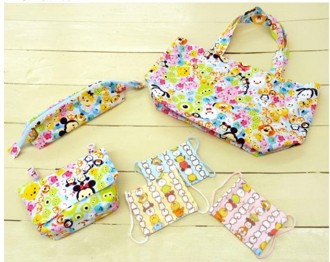
Based on the "Winnie the Pooh" works, by A.A. Milne and E.H. Shepard