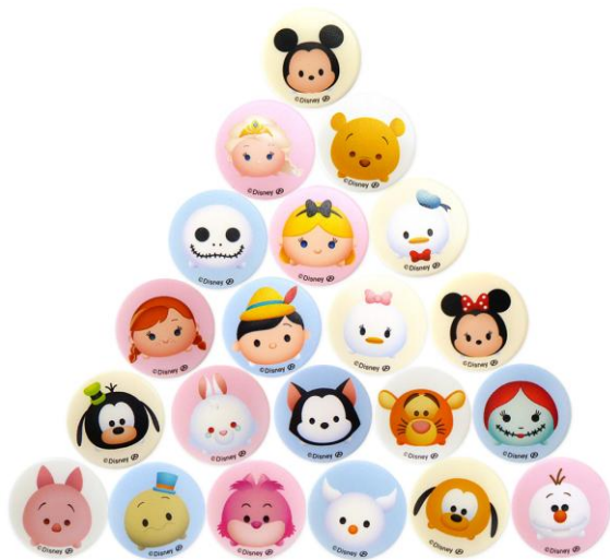
Based on the "Winnie the Pooh" works, by A.A. Milne and E.H. Shepard