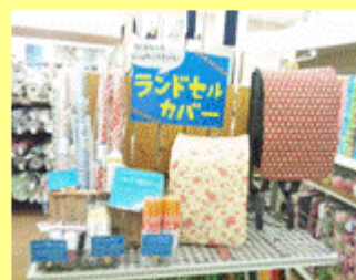
右: ランドセルカバー

手作りのマスクやランドセルカバーなど、入園、入学を控えているお子様をもつママや、手芸デビューを考えている育メンパパを応援しています。