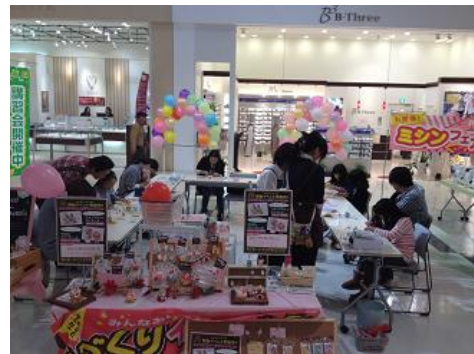
↑クラフトハート トーカイ南砂町 sunamo店 2012年11月3日、4日(日) スイーツデコ作品

手作り作品を募集するコンテストや、入賞作品の展示会、初心者でも気軽に参加できる時期に応じた作品づくりの講習会など、幅広く開催しています。