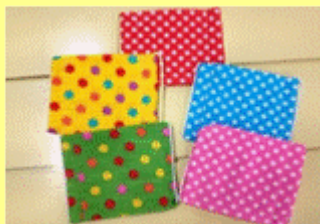
↑上: 手づくりマスク

作り図と材料がセットになっており、見本品と同じ作品を短時間で簡単に作ることができます。藤久では オリジナルの作り図を作成 し、生地などの種類も豊富にあり、様々な作品提案を行っています。また各店舗でオリジナルの材料セット組を展開。