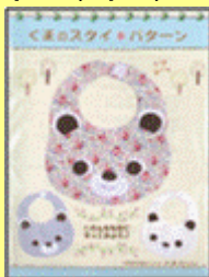
↓下: スタイパターン

手芸キットと違い、作品のメインとなる部分(布、毛糸など)をキットから外しています。メイン部分は店頭での生地などの商材からお好きな色、お好きな柄を選んでいただき、お客様の オリジナリティ を表現できるようにしています。