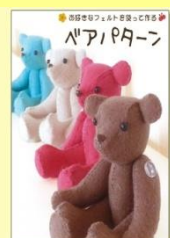
↑上: ぬいぐるみパターン