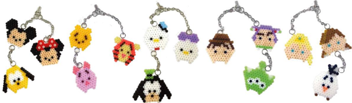
©DISNEY ©Disney/Pixar ©DISNEY. Based on the "Winnie the Pooh" works by A.A. Milne and E.H. Shepard.

9月以降も、まだまだ魅力的な「ディズニーツムツム」新作商品が入荷します。この秋は、世界で一つの「MYツムツムグッズ」を手作りしてみたいはいかがでしょうか。