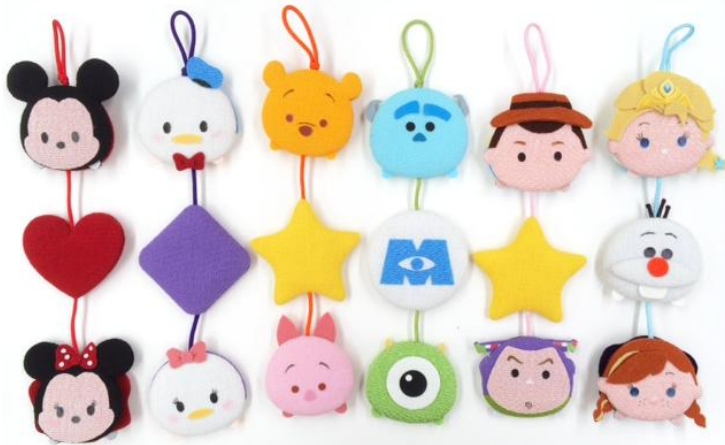
Based on the "Winnie the Pooh" works by A.A. Milne and E.H. Shepard.