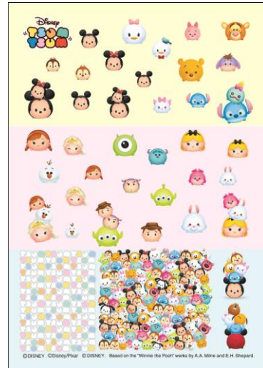
Based on the "Winnie the Pooh" works by A.A. Milne and E.H. Shepard.