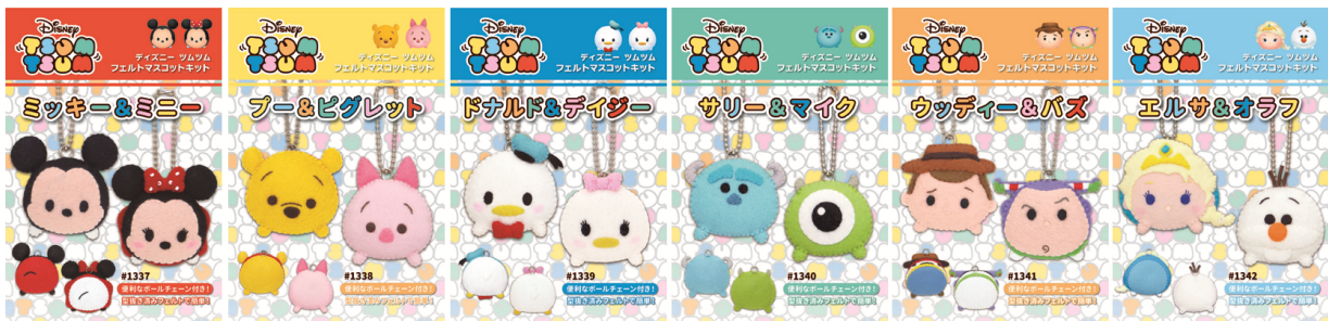
©DISNEY ©Disney/Pixar ©DISNEY. Based on the "Winnie the Pooh" works by A.A. Milne and E.H. Shepard.