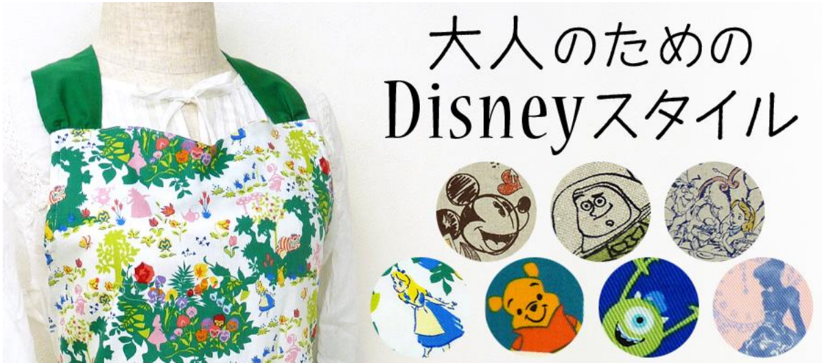
©DISNEY ©Disney/Pixar ©DISNEY. Based on the "Winnie the Pooh" works by A.A. Milne and E.H. Shepard.

全国で展開中の手芸専門店「クラフトハート トーカイ」を主力に、手芸用品や衣料品・服飾品、その他生活関連雑貨などを販売する藤久株式会社(代表取締役社長:後藤 薫徳/名古屋市)では、大人ディズニーデザインのオリジナル生地の新デザインが続々と入荷しています。