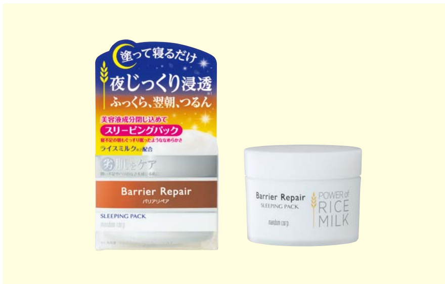
バリアリペア スリーピングパック