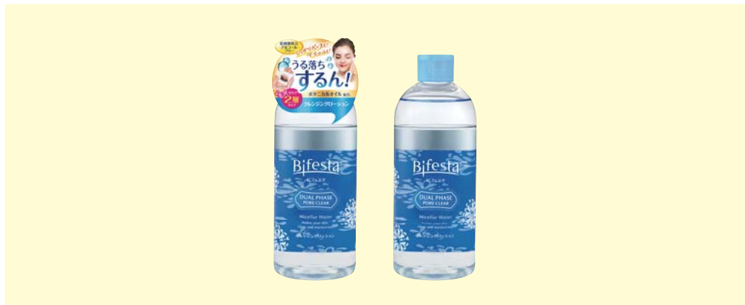
ビフェスタ クレンジングローション デュアルフェイズ ポアクリア