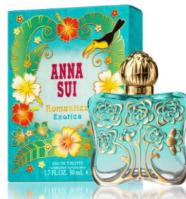
ANNA SUI エキゾティカ オーデトワレ