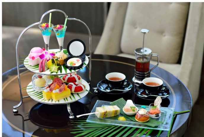
アイランドドリーム アフタヌーンティー&カクテル with ANNA SUI

東京マリオットホテル(東京都品川区 総支配人:飯田雄介)では、2016年8月1日(月)～11月30日(水)の期間で人気ファッションブランド「ANNA SUI」とのコラボレーション第二弾として、ホテル内レストラン「ラウンジ&ダイニングG」(1F)にて『アイランドドリーム アフタヌーンティー&カクテル with ANNA SUI』を開催いたします。昨年に続き、今年は日本上陸20周年を記念し更に色鮮やかに、新作フレグランス『ANNA SUI エキゾティカ オーデトワレ』の世界観をスイーツやカクテルで表現いたします。五感で楽しむ ANNA SUI のリゾートエクスペリエンスを、都心の緑を望み開放感あふれるホテルラウンジ空間の寛ぎとともにご堪能下さい。オーデトワレのミニボトル(4ml)をプレゼントいたします。