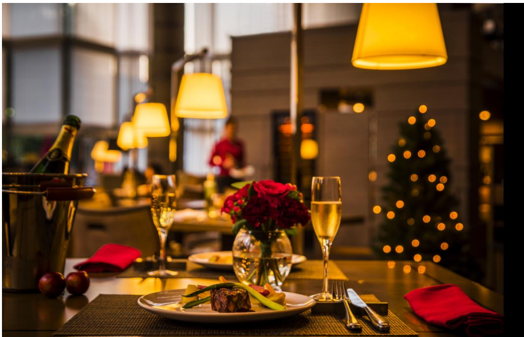
クリスマスディナーコース「Glisten Dinner グリステン ディナー」