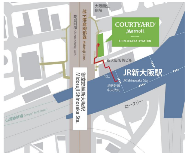
— 新幹線中央改札からの経路