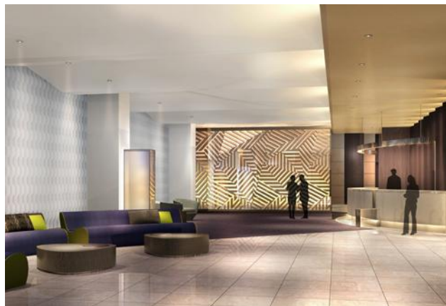
フロントロビーイメージ

2015年11月2日に開業するコートヤード・バイ・マリオット 新大阪ステーション(所在地：大阪市淀川区宮原 1-2-70)では、宿泊予約の受付を2015年9月1日(火)より開始いたします。また、これにあわせて、ホテルオリジナルのウェルカムドリンクと、朝食buffetがセットされた開業記念特別宿泊プラン「Smart Choice」 スマートチョイス を発売いたします。世界中で愛されるコートヤード・バイ・マリオットのリフレッシュなホテルステイを、大阪でご体験下さい。