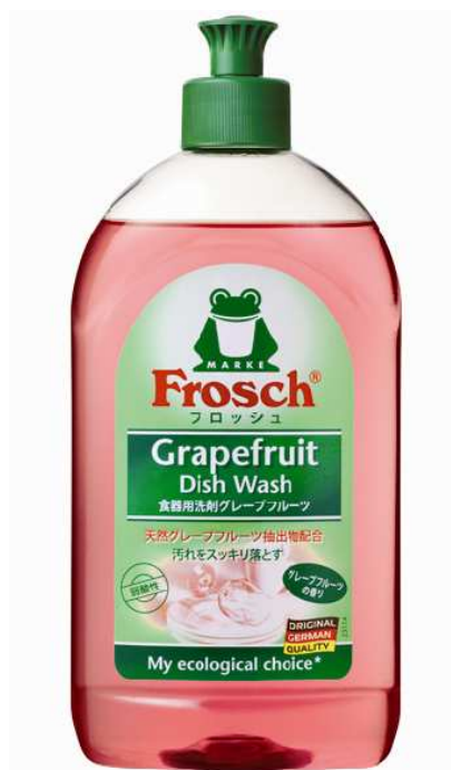
食器用洗剤グレープフルーツ

フロッシュ 食器用洗剤 グレープフルーツは、たっぷり泡立ち、油汚れをしっかり落とす洗浄力がありながら、手肌にやさしい製品です。当社が行った調査では、『86.2%の主婦がフロッシュのブランドコンセプトである「十分な洗浄力」「環境への配慮」「手肌へのやさしさ」を実現している製品』であると評価しました。