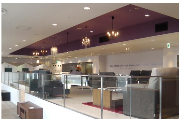
<Armonia アクアシティお台場店/2013年3月1日オープン>