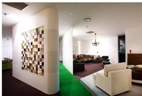
【グッドデザイン賞 2009 受賞】<Armonia 広島店>