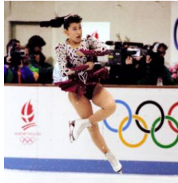
アルペールビル五輪で銀メダルを獲得した伊藤みどりさん(1992年)