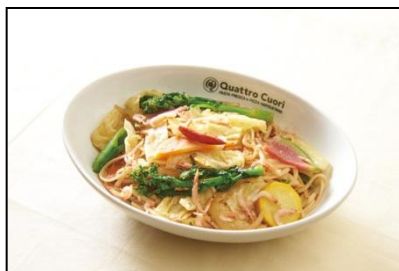
【クアットロ クオーリ】 桜エビと1/2日分の野菜ペペロ ニーノ ¥1,100(税込)