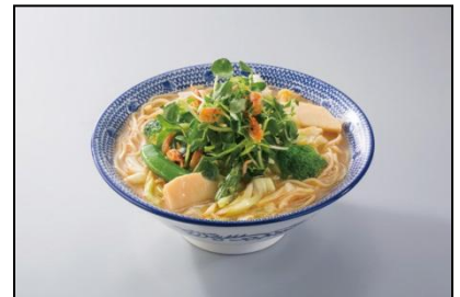
【チャイニーズレストラン 西安餃子】 7種野菜と桜エビのスープ麺 ¥950(税込)