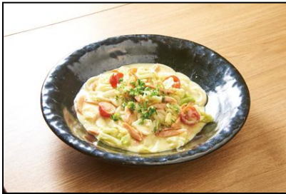
【あんぷく】 キャベツとチオリソのマスタードク リーム ¥1,000(税込)

クアットロ クオーリ／椿屋カフェ／赤坂 大関／札幌銀鱈／あんぷく／カプリチョーザトマト&ガーリック 越後叶家／チャイニーズレストラン 西安餃子／板前ごはん 音音／サイアムヘリテイジキッチン 波照間／BISTRO309／Eggs 'n Things／California Pizza Kitchen／南国酒家 NANGOKUSYUKA