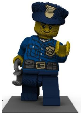
レゴ®シティ ポリスマン3Dモデル