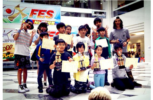
KDX FES2015の様子(ケンダマブレイク)

◆KDX FES2016(ケンダマクロス日本一決定戦) 【開催日】 2016年3月20日(日・祝) ※雨天決行 【開催時間】 10:00～17:00 【開催場所】 2F ルーフア広場 【参加費】 無料 ※詳しくは、特設ホームページをご確認ください。 http://www.asovision.com/kdx/event/kdx_fes_2016/