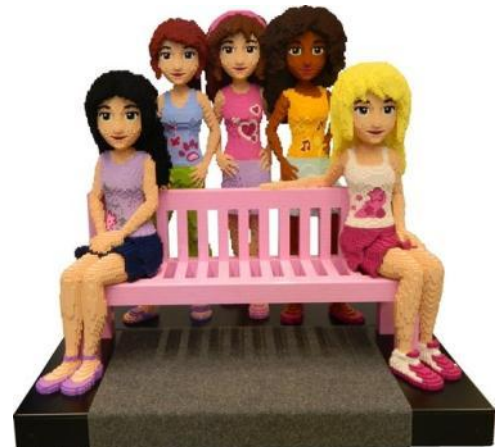
レゴ®フレンズ 3Dベンチモデル