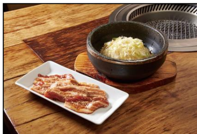
【赤坂 大関】 ねぎ飯 ¥1,200(税込)