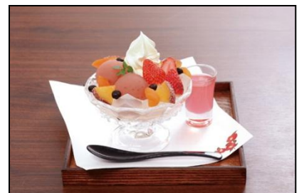
【椿屋カフェ】 桜のクリームあんみつ～桜シロップ 添え～ ¥1,100(税込)