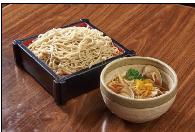
【越後叶家】 蛤つけ汁そば ¥1,380(税込)