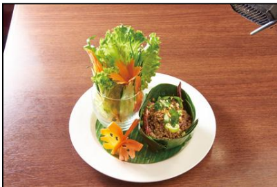
【サイアムヘリテイジキッチン】 豚ひき肉のハーブサラダ(ラープムー) (チェンマイスタイル) ¥1,200(税込) ※平日ランチタイムは除く