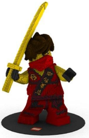
レゴ®ニンジャゴー カイ3Dモデル