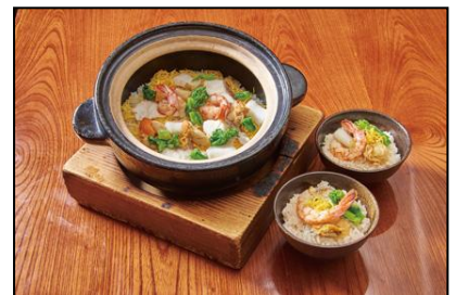
【板前ごはん 音音】 春の彩り海鮮土鍋ご飯 一人前¥1,080(税込) ※ディナータイムのみ