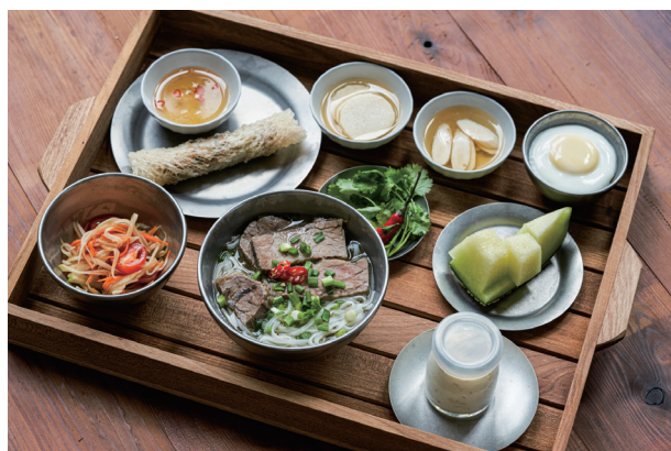
フォーかバインミーから選べる朝ごはん20,000ウォン(約1,900円~)