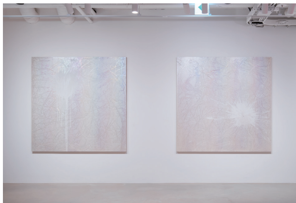
地下1階フロントエリアのアート。館全体のサウンドスケープは原摩利彦氏が手がけます。