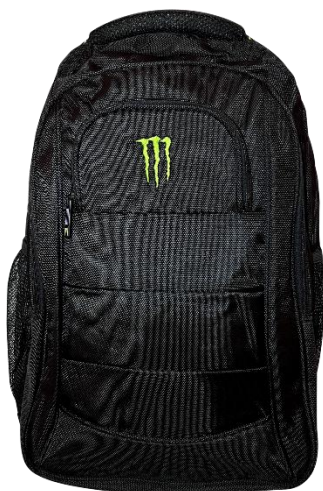
モンスターバックパック