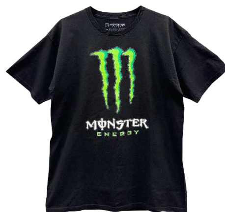
モンスターTシャツ