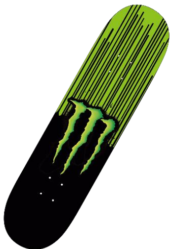
モンスタースケートボード

※対象期間、賞品は各企業によって異なります。詳細は店頭販促物及び上記Webページをご確認ください。